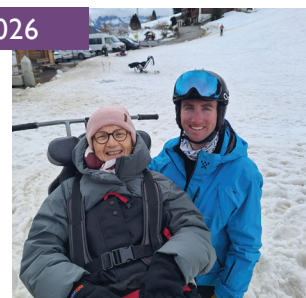
Sorties ski à Combloux