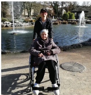
Balade au Parc des Ecureuils

Profitant des premiers beaux jours, une sortie au Parc des Écureuils a été organisée. Cette promenade en pleine nature a été très appréciée par les résidents des «Edelweiss». Pour beaucoup d'entre eux, ce lieu évoque des souvenirs d'anciennes sorties en famille, suscitant échanges, anecdotes et moments d'émotion.