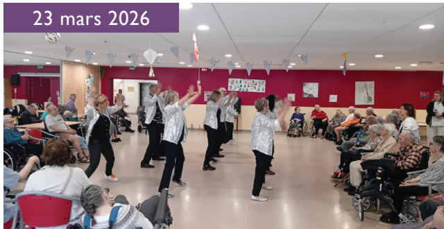
Show musique et danse à Bonneville

Grâce à l'Association «Vita'Dance» de Marignier, chaque note, chaque pas de danse et chaque paillette sont des étincelles de bonheur pour nos résidents. Les rythmes entraînants et les sourires qui s'éveillent créent des instants magiques, où mémoire et joie se rencontrent.