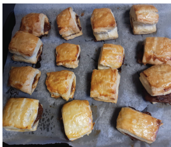
Atelier Rissoles à Marnaz

Grâce à la fille d'une résidente, tous les résidents de la résidence ont eu la chance de faire des rissoles, une pâtisserie très appréciée dans la région. Une pâte feuilletée à travailler, à étaler, puis à garnir de compote pomme-poire... tout le secret d'un moment savoureux !