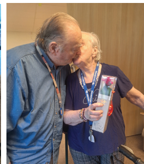
Repas de la Saint-Valentin à Marnaz