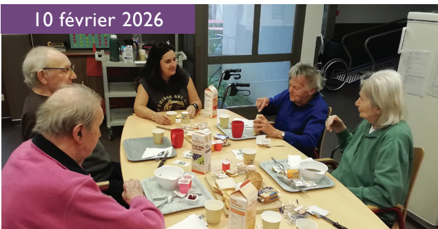
Petits déjeuners thérapeutiques à Ambilly

Tous les mardis et les jeudis, le petit déjeuner thérapeutique permet aux résidents de participer à la préparation et au partage de ce moment convivial. Cet atelier encourage l'autonomie, stimule les capacités cognitives et favorise les échanges entre les participants.