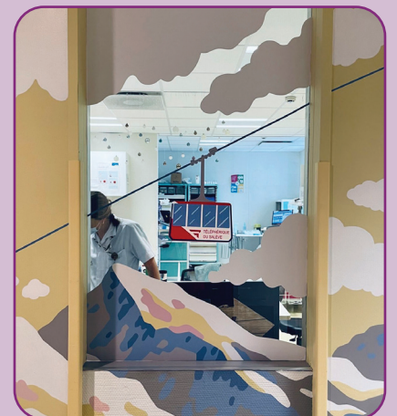
Une fresque qui invite au voyage... en téléphérique !