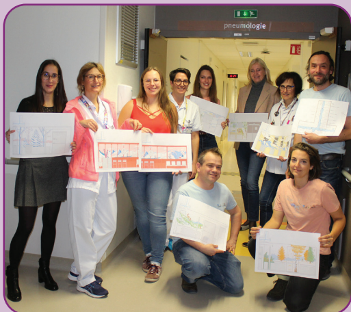
Une partie de l'équipe PAINT A SMILE avec les professionnels du Service de Pneumologie, lors de la présentation des maquettes, le 13 novembre dernier

Ce projet artistique pensé par l'équipe médico-soignante voit le jour grâce à la générosité des mécènes du Fonds de dotation SIRHÔ et aux partenaires de PAINT A SMILE.