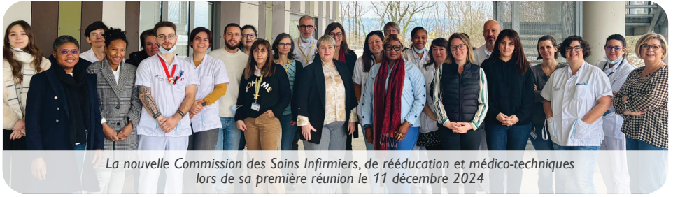
La nouvelle Commission des Soins Infirmiers, de rééducation et médico-techniques lors de sa première réunion le 11 décembre 2024

Les élections de la CSIRMT se sont tenues du 18 au 22 novembre dernier. Vous trouverez dans l'encadré ci-contre sa nouvelle composition. C'est l'occasion pour l'InfoCHAL de faire un focus sur cette instance de réflexion, de partage et force de proposition de l'ensemble des professionnels paramédicaux.