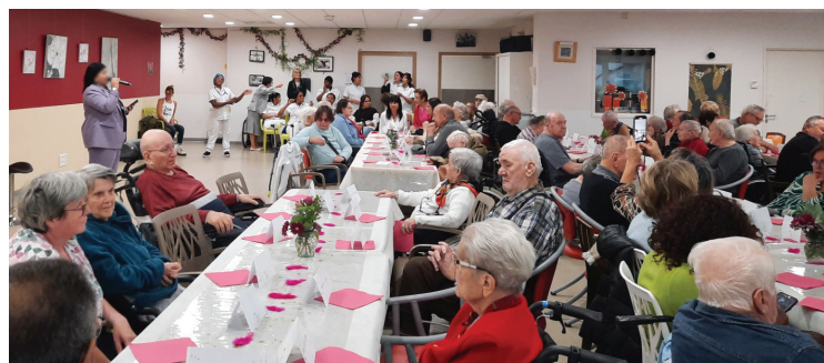
Accordéon, chant et jeux au programme du goûter annuel des familles