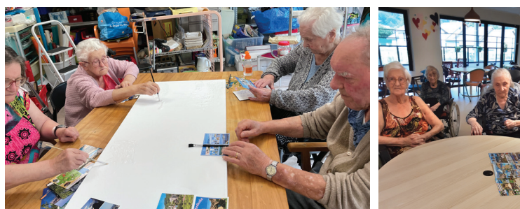
Ateliers de discussion et d'art plastique organisés autour de la réception des cartes postales